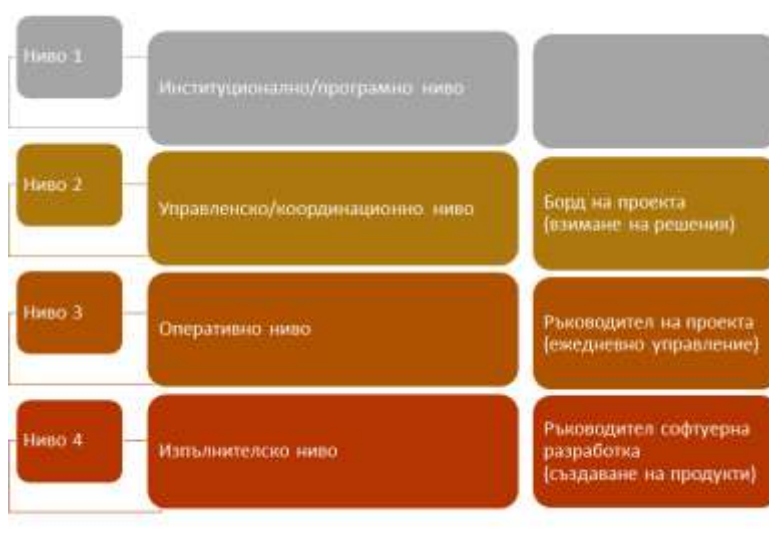
Фигура 2. Организация за изпълнение на проекти в НОИ

За управление на информационните си ресурси, НОИ прилага водещи методологии за управление на ИТ проекти чрез организация за изпълнение на проектите на четири нива (Фигура 2).